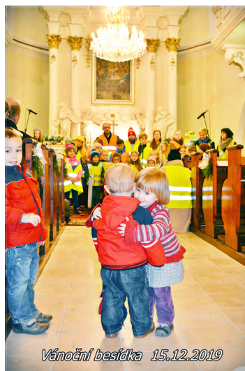
Vánoční besídka 15.12.2019

Možná i vy jste měli podobné myšlenky, pokud jste navštívili třetí adventní neděli náš náveský kostel. Záhy se však ukázalo, že ti malí pracovníci jsou děti, které se inspirovaly prací svých rodičů, prarodičů na přestavbě kostela. Na vánoční vystoupení si s sebou vzaly smetáky, lopaty, hadříky nechyběly jim ani „točky“ a nějaké ty leštěnky, aby se všechno blýskalo. Ale co má společného smeták a Vánoce? Nejen to, že se před Vánoci používá