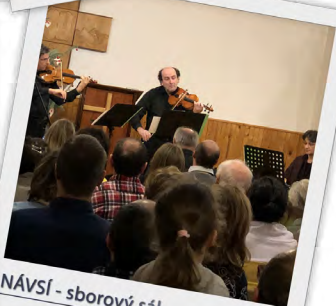
NÁVSÍ - sborový sál

Tématy modlitebních setkání byly myšlenky Jana Amose Komenského, tento rok si připomeneme 350 let od jeho úmrtí. Lidskost lidí není docela v pořádku, ale není docela ztracena. Existuje východisko, naděje. Tato myšlenka Jana Amose Komenského je aktuální i v naší době. Tématy společných zamyšlení a modliteb byla vláda, politika a věci veřejné, církve, umění, média, podnikavost, vzdělání, rodina. Na všechna tato témata bychom určitě neměli ve svých modlitbách zapomínat. Jediné východisko, jediná naděje na nápravu našich lidských věcí je v Bohu.