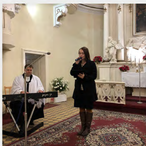
NÁVSÍ - bohoslužba Epifanie